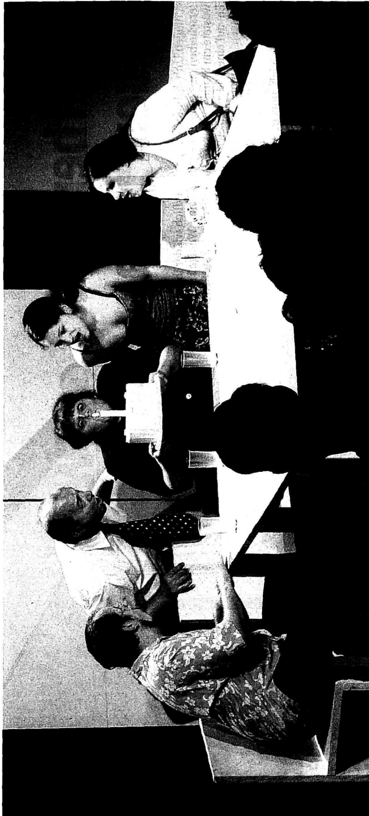
Theaterprojekt: Armutserfahrene Menschen sind die Hauptakteure und zeigen, wie leicht eine Familie in die Armutsspirale kommt. Das Publikum kann die Handlung reflektieren