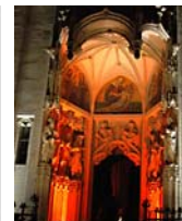
Lange Nacht 2010